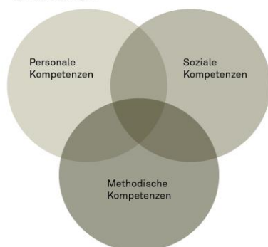
Abbildung 2: Personale, soziale und methodische Kompetenzen und ihre Überschneidungen

Lehrplan 21: Personale, soziale und methodische Kompetenzen und ihre Überschneidungen